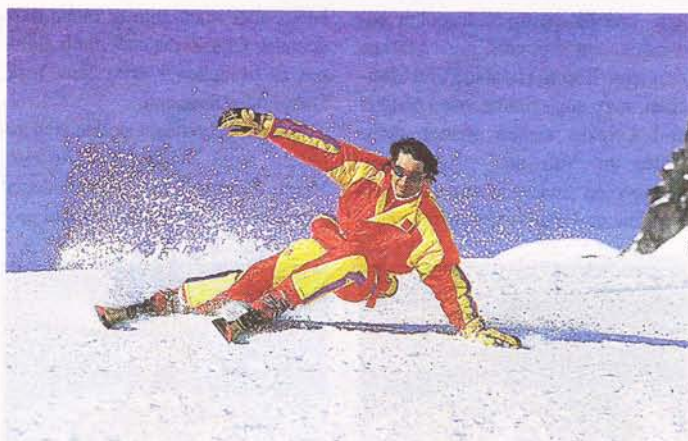
Auch das lässt sich erlernen, aber kaum so rasch.