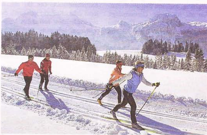
Skischulen der Region garantieren: Skilauf-Lernen in drei Tagen.

gelten hier vom 7. Januar bis 4. April 2009: 7 Übernachtungen mit Frühstück in einer Pension im DZ mit Dusche und WC, 6-Tage-Großraum-Skipass für die Skiregion Dachstein-West, Abtenau, St. Martin, Lungötz und Postalm gibt es pro Person im Doppelzimmer ab 255 Euro. Infos: www.lammertal.info