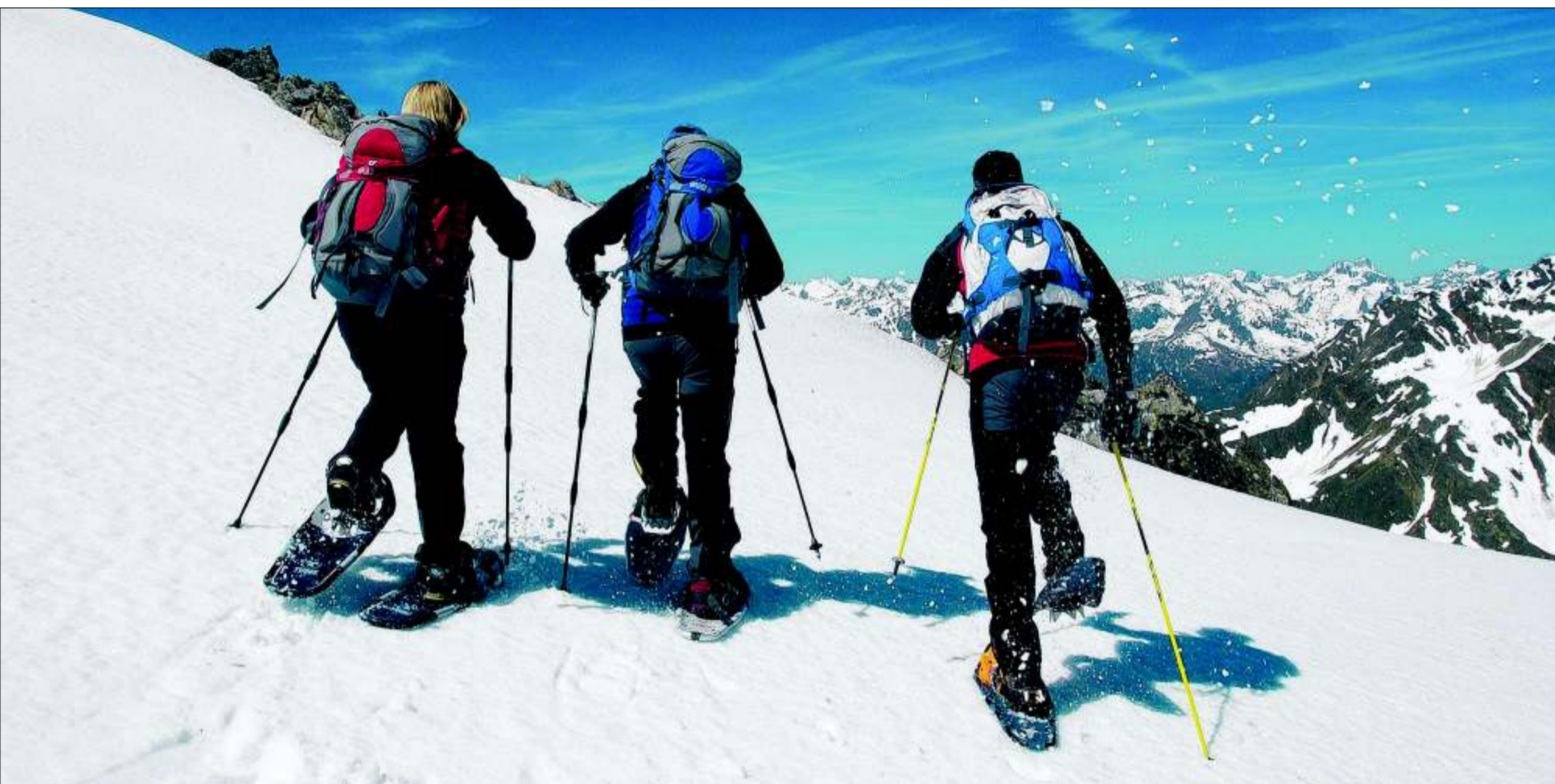
Versteckt zwischen den Skigebieten Dachstein West und Flachau ist das weite Lammertal ein Rückzugsgebiet für Erholungssuchende und Genussmenschen.