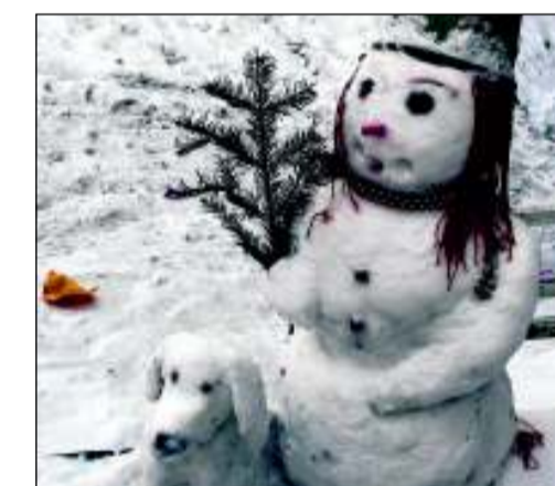
Spaß im Schnee