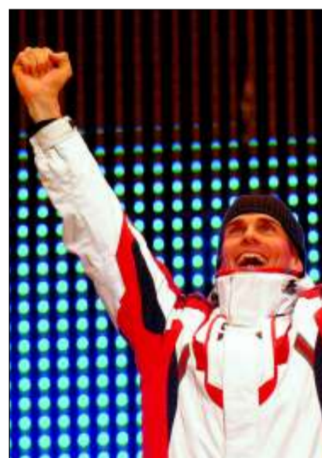
Der Olympiasieger 2006: Gottwald