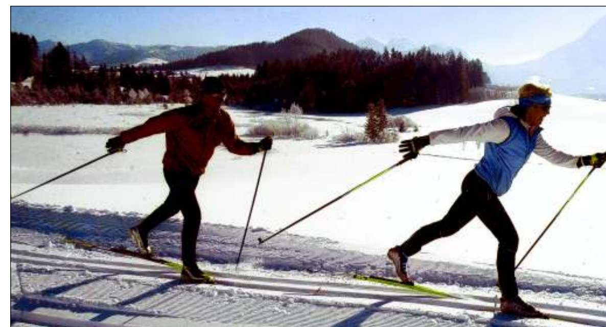
Rund 150 Kilometer gespurte Langlaufloipen locken ins Lammertal.