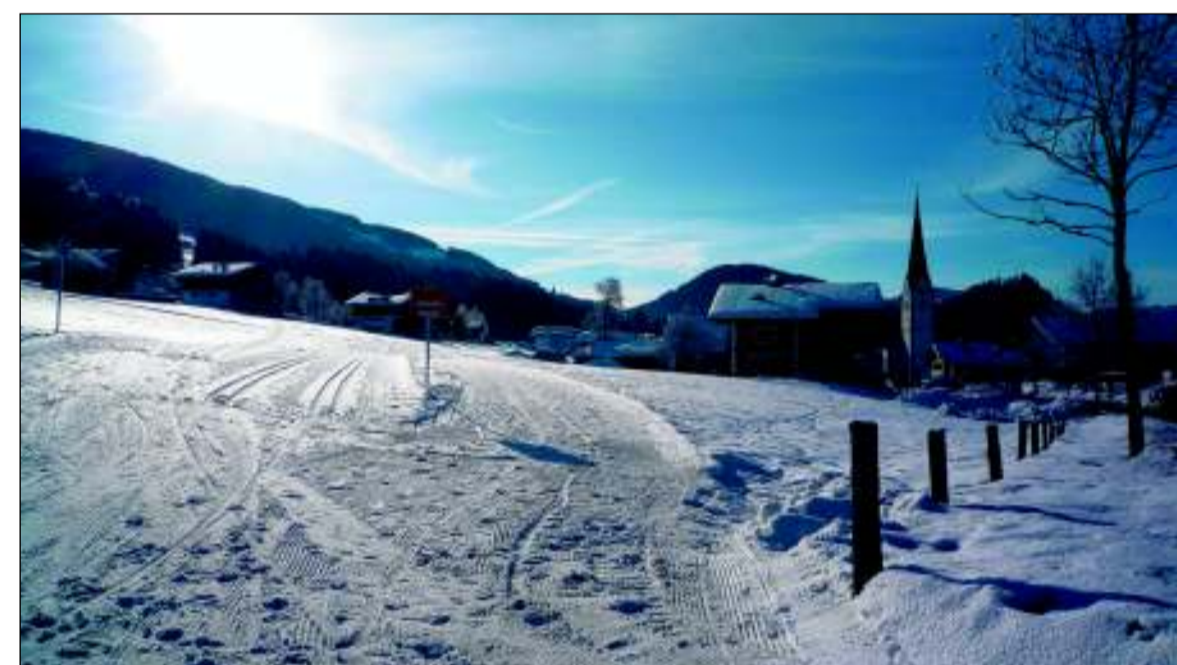
Ein Spaziergang im Winterwunderland gefällig?